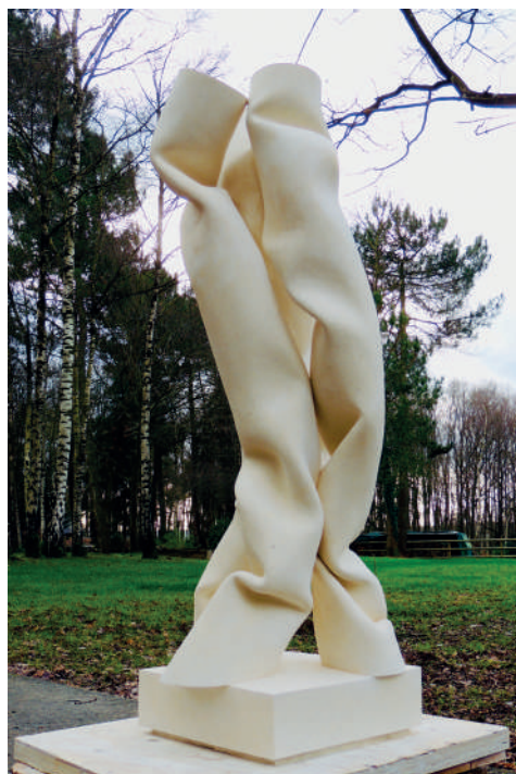
Michel VION Pierre de lavoux - Ht : 1M35