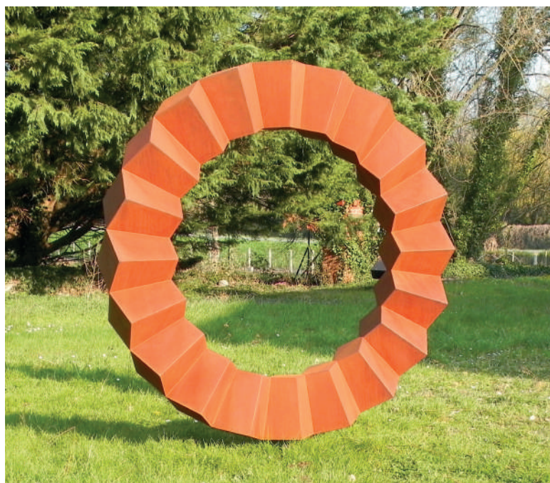
Stéphane DUCATTEAU Acier CORTEN - Ht : 2M