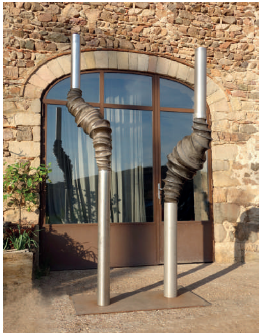
Mathilde PENICAUD Inox et peau de béton - Ht : 2M50