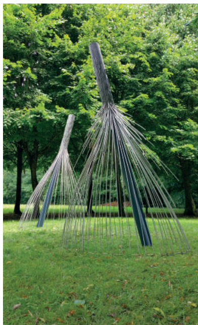
Romain REVEILLAC Inox - Ht : 3M