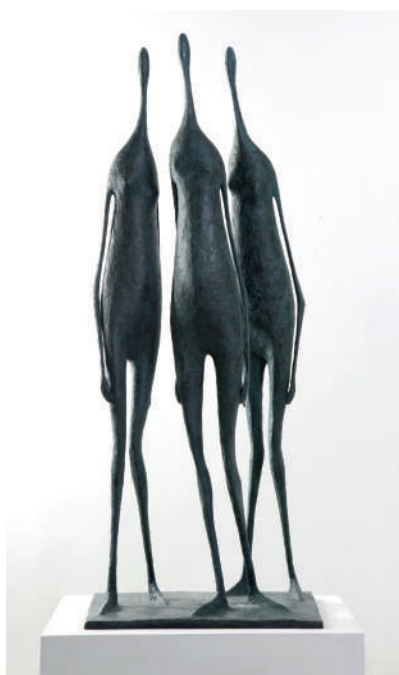
Pierre YERMIA Bronze - Ht : 1M50