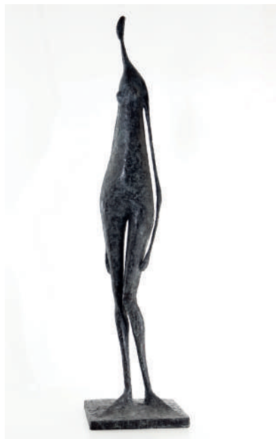
Pierre YERMIA Bronze - Ht : 2M50