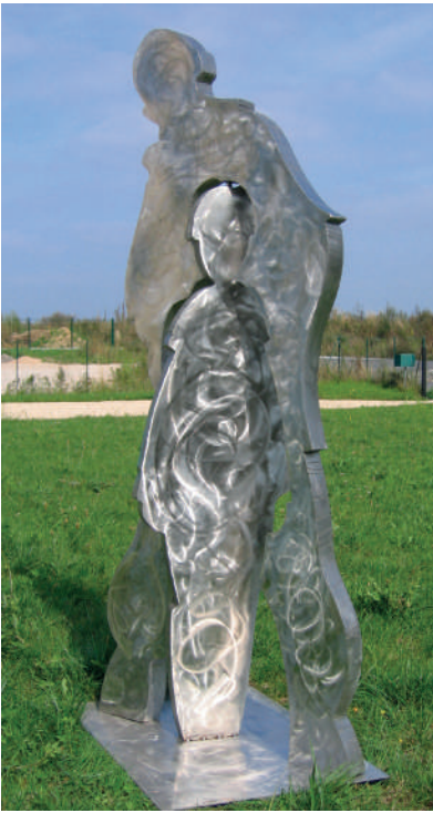
Guillaume ROCHE Inox - Ht : 1M62