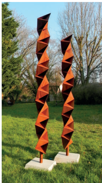
Stéphane DUCATTEAU Acier CORTEN - Ht : 2M70