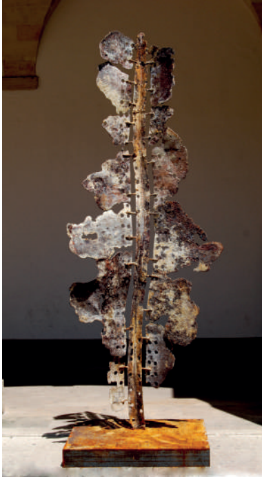
Alice MORLON Fer - Ht : 2M80