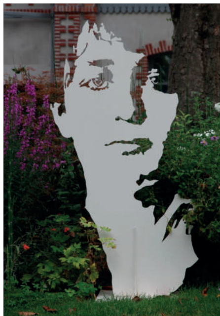
Michel AUDIARD Inox - Ht : 1M58