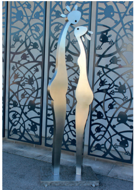
Charles STRATOS Inox - Ht : 2M17