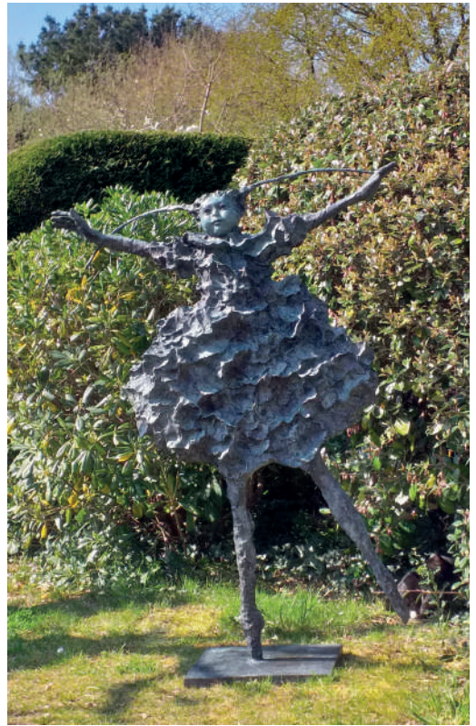
Martine KERBAOL Bronze - Ht : 1M40