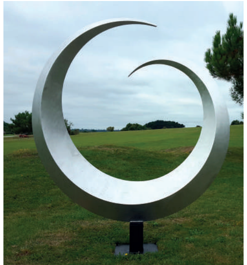
Francis GUERRIER Aluminium - Ht : 2M10