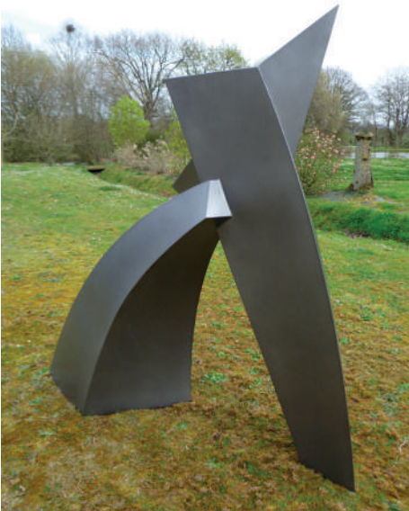
Caroline CORBEAU Acier - Ht : 2M